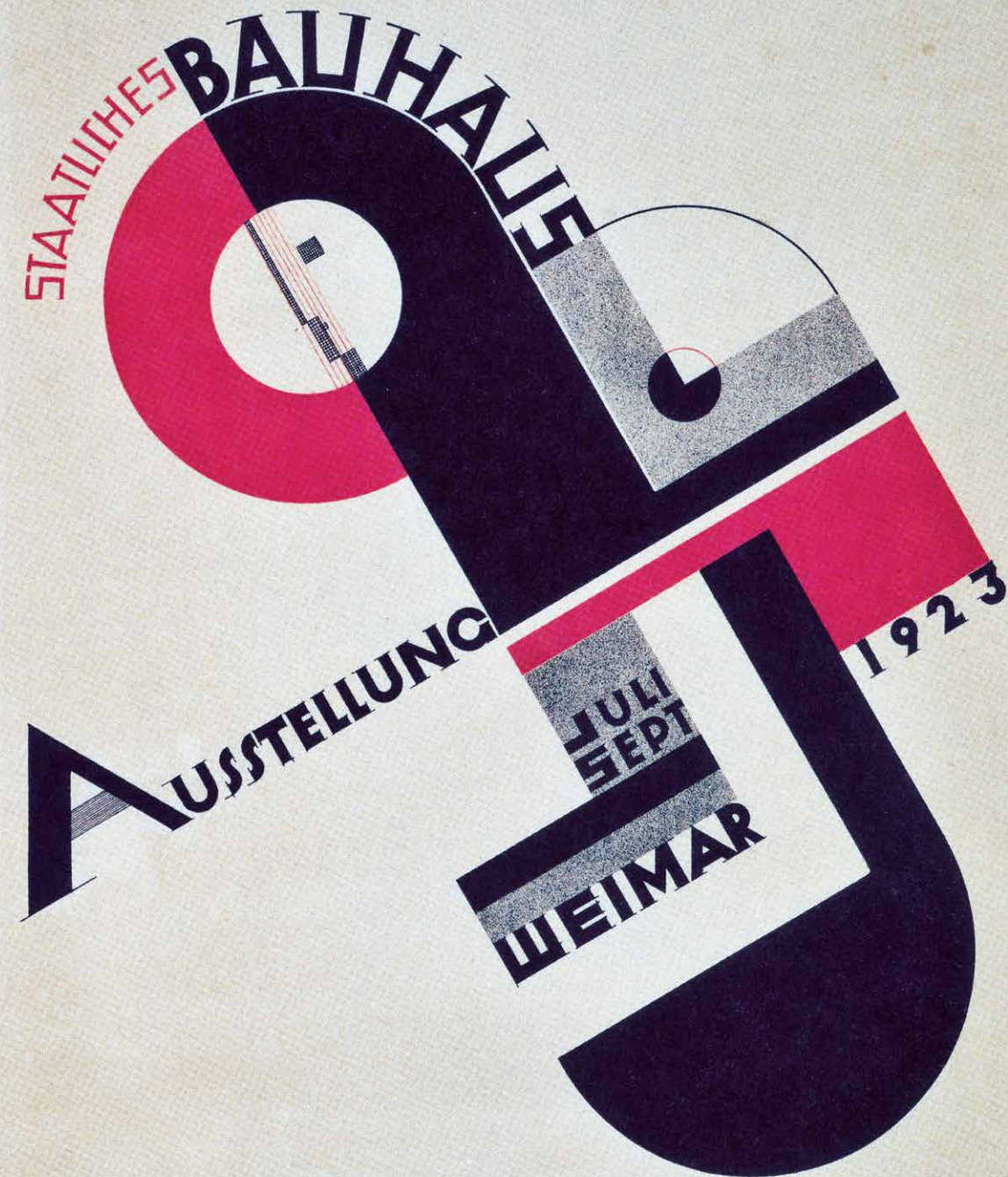
Joost Schmidt, αφίσα για την έκθεση του Μπράουχαους στη Βαϊμάρη, 1923. Joost Schmidt, poster for the Bauhaus Exhibition, Weimar, 1923.