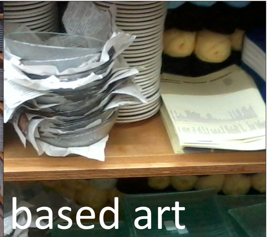
text based art