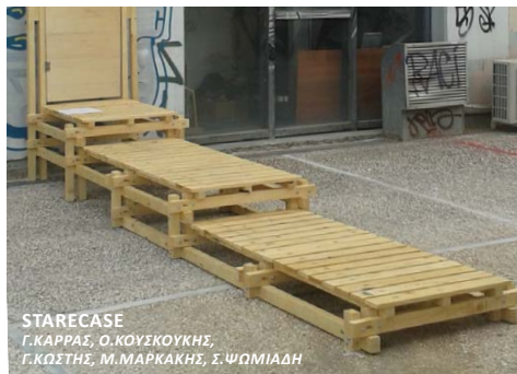
STARECASE Γ.ΚΑΡΡΑΣ, Ο.ΚΟΥΣΚΟΥΚΗΣ, Γ.ΚΩΣΤΗΣ, Μ.ΜΑΡΚΑΚΗΣ, Σ.ΨΩΜΙΑΔΗ