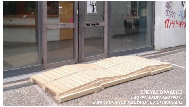
ΣΠΕΥΔΕ ΒΡΑΔΕΟΣ Γ.ΔΟΥΡΑ, Ι.ΚΟΥΛΑΔΟΥΡΟΥ, Β.ΜΗΤΡΟΠΟΛΑΝΟΥ, Χ.ΣΟΥΛΙΩΤΗ, Κ.ΣΤΕΦΑΝΙΔΗΣ