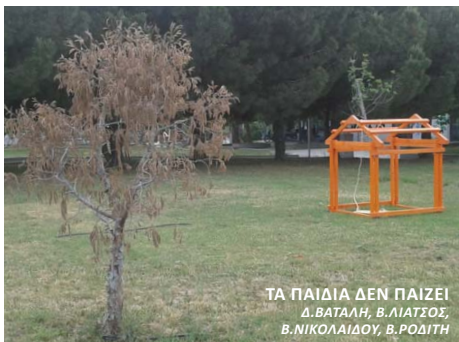
ΤΑ ΠΑΙΔΙΑ ΔΕΝ ΠΑΙΖΕΙ Δ.ΒΑΤΑΛΗ, Β.ΛΙΑΤΣΟΣ, Β.ΝΙΚΟΛΑΪΔΟΥ, Β.ΡΟΔΙΤΗ