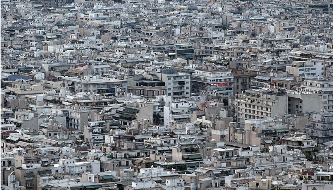
Σχήμα 2. Athens Spread, Γιώργης Γερόλυμπος, 2012.

ανέφικτο να αρθεί η αίσθηση αστικού αποκλεισμού και απομόνωσης σε τμήματα της πόλης. Οι περιοχές που κατοικούνται και τροφοδοτούνται από τους παρίες της ελληνικής οικονομικής κρίσης (μετανάστες, άστεγοι, άνεργοι) δεν αποτελούν αντικείμενο του επίσημου αστικού σχεδιασμού σε επίπεδο πολιτικής στόχευσης.