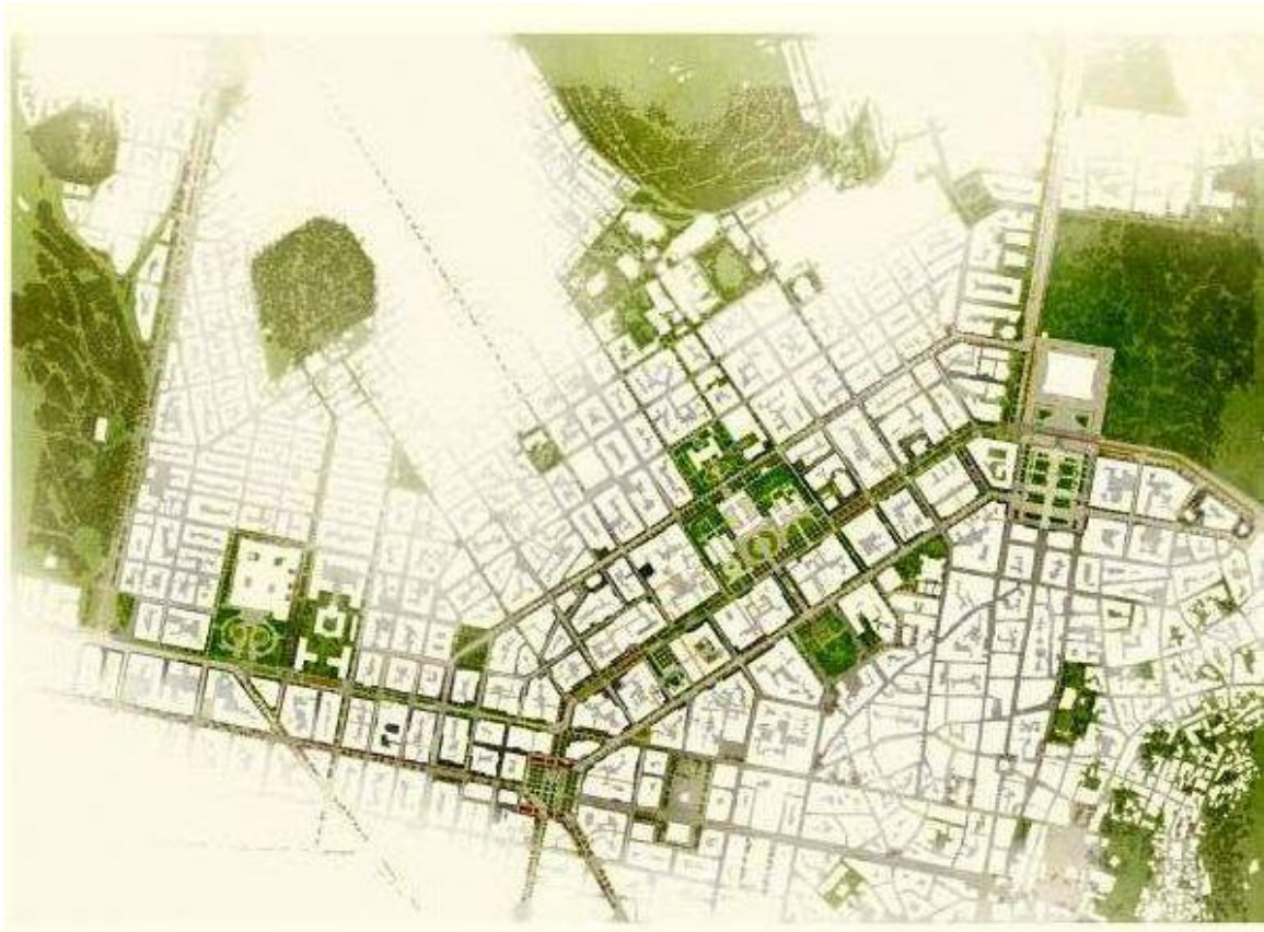
Σχήμα 3. Διαγωνισμός Rethink Athens.