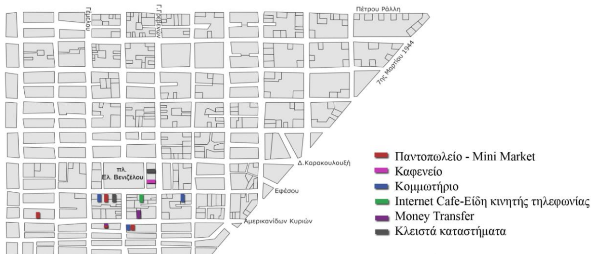
Σχήμα 3: Χάρτης καταγραφής των καταστημάτων μεταναστών στην περιοχή μελέτης. Αποτελέσματα εμπειρικής έρευνας.

και τη θέση τους με γεωγραφικά στοιχεία από το Ε.Ε.Π. εντοπίζονται αποκλίσεις, που πιθανά να οφείλονται σε ελλείψεις καταγραφές. Τα καταστήματα των μεταναστών, είναι αναγνωρίσιμα στο χώρο εύκολα, κυρίως από τις προσόψεις τους. Συνήθως αυτό οφείλεται είτε στις πινακίδες με το όνομά τους, είτε σε αναρτημένες ανακοινώσεις που έχουν στην πρόσοψη σε άλλες γλώσσες – πλην της ελληνικής, είτε στη διαφορετική μορφολογία και πολυχρωμία του εσωτερικού που γίνεται εμφανής από έξω. Στις 3 από τις 6 συνεντεύξεις που πραγματοποιήθηκαν, ο ιδιοκτήτης του καταστήματος είχε καταγωγή από το Πακιστάν, ενώ πολύ συχνό ήταν το φαινόμενο απασχόλησης ομοεθνών ως υπαλλήλων, από τους ιδιοκτήτες των καταστημάτων.