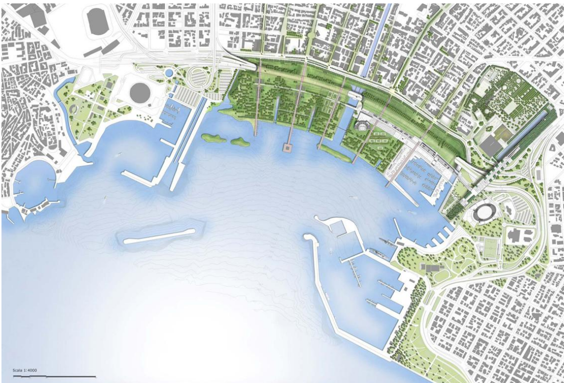
Σχήμα 4. Ανάπλαση Φαληρικού Δέλτα.