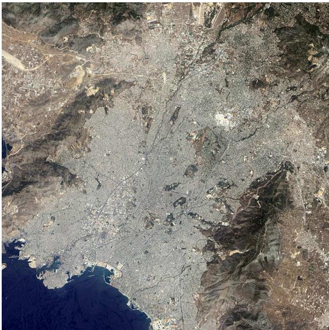
Σχήμα 1. Δορυφορική άποψη της Αθήνας