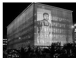
Σχήμα 5. Η Στέγη Γραμμάτων και Τεχνών

Όσον αφορά τώρα στην ανέγερση δημοσίων κτηρίων πνοής, όπως και στις περιπτώσεις των προηγούμενων κρίσεων, έτσι και τώρα πολύ συχνά είναι αποτελέσματα ευεργεσιών. Το 2010 εγκαινιάστηκε στην Αθήνα η Στέγη Γραμμάτων και Τεχνών, ένα κέντρο πολιτισμού 23 . (αρχ. Architecture Studio) δωρεά Ιδρύματος Ωνάση(Σχήμα 5).