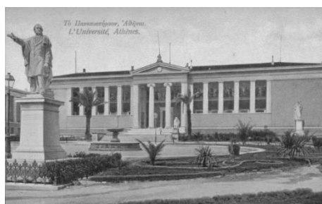
Σχήμα 1. Το Πανεπιστήμιο Αθηνών σε επιστολικό δελτάριο του 1910.

Κτίζονται πολλά σε αριθμό νέα κτήρια, (Νομισματοκοπείο, το Τυπογραφείο, το Δημοτικό Θέατρο, το Πολιτικό Νοσοκομείο κ.α.). Στο ίδιο πνευμα ανάπτυξης της χώρας λειτουργεί και η Αντιβασιλεία. Η καταφυγή στην αναζήτηση μεγάλων ευεργετών αποτελεί την πλέον συνήθη