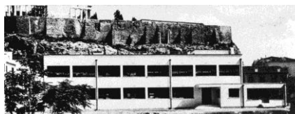
Σχήμα 4. Το Δημοτικό σχολείο στην Ακρόπολη

Την Τετάρτη 27 Απριλίου 1932 η Ελλάδα με πρωθυπουργό τον Ελ. Βενιζέλο εγκατέλειψε επίσημως τον "κανόνα του χρυσού", η δραχμή υποτιμήθηκε ραγδαία και τον ίδιο μήνα το κράτος επισημοποίησε την χρεοκοπία του κηρύσσοντας παύση πληρωμών. Στην παρουσίαση των προγραμματικών δηλώσεων της νέας κυβέρνησης, (19.8. 1928), ο Βενιζέλος στη Βουλή μίλησε για ένα ιδιαίτερα φιλόδοξο πρόγραμμα δημοσίων επενδύσεων, οι οποίες, θα έβαζαν την οικονομία της Ελλάδας σε μια αναπτυξιακή πορεία παρότι η χώρα δεν διέθετε τα ανάλογα κεφάλαια. Η καταφυγή ήταν και πάλι ο εξωτερικός δανεισμός . Εκτός από την επίλυση του προσφυγικού, το πρόγραμμα περιλάμβανε συμβάσεις για έργα υποδομής : της κοιλάδας του Στρυμόνα, τα εγγειοβελτιωτικά Θεσσαλίας, Ηπείρου και Κρήτης, εξηλεκτισμού στην Αθήνα, τις τηλεπικοινωνίες, το τηλεγραφικό δίκτυο και τις ασύρματες επικοινωνίες 19 . Τελικά όμως, ο εξωτερικός δανεισμός και το μεγαλόπνοο πρόγραμμα του Βενιζέλου, οδήγησαν στην οικονομική καταστροφή, αφού ήταν αδύνατη η εξυπηρέτηση των δανείων που είχαν παρθεί για τα έργα αυτά. Σημαντικό από κάθε άποψη έργο της τετραετίας του Ελ. Βενιζέλου ήταν το πρωτόγνωρο σε ποσότητα