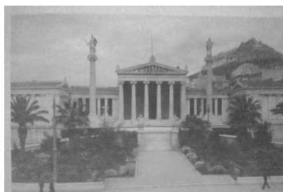
Σχήμα 2. Η Ακαδημία Αθηνών

Η οικονομική δυσπραγία του κράτους στο τομέα των δημόσιων επενδύσεων κράτησε περίπου έως το 1862 και οι επενδύσεις του κράτους σε δημόσια κτήρια είναι μηδαμινές. Όμως και πάλι οι έλληνες ομογενείς μέσω της ευεργεσίας προσέφεραν χρήματα για την ανέγερση σπουδαίων οικοδομημάτων με ιδιαίτερο αρχιτεκτονικό ενδιαφέρον. Το Αστεροσκοπείο Αθηνών (1843, Θ. Χάνσεν, δωρεά Γ. Σίνα 4 , το Αρσάκειο Παρθεναγωγείο, Λυσ. Κανταντζόγλου 1846-1852, δωρεά Απ. Αρσάκη 5 , το Βαρβάκειο Λύκειο (1857-1859, αρχ. Π. Κάλκος, δωρεά του εμπόρου Βαρβάκη είναι κάποια από αυτά, ενώ το σπουδαιότερο είναι αυτό της Ακαδημίας Αθηνών (1859, αρχ. Χρ. Χάνσεν, δωρεά βαρόνου Σίμ. Σίνα) (Σχήμα 2). Παράλληλα, το