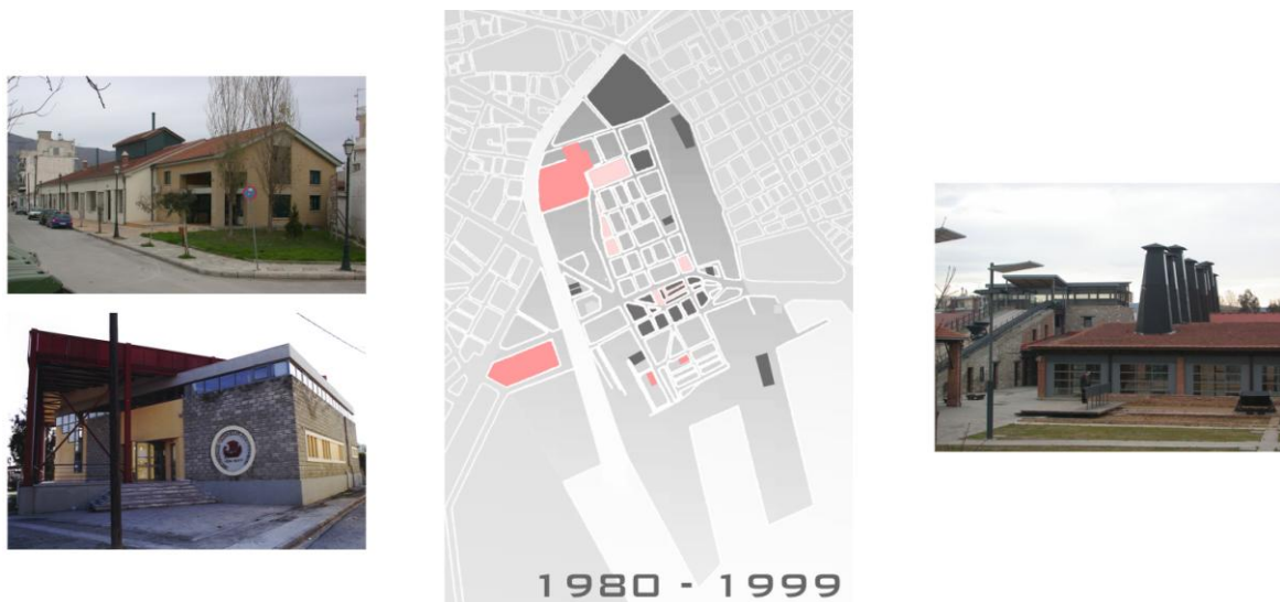
Σχήμα 4. Οι βιομηχανίες που επαναχρησιμοποιήθηκαν στην περιοχή μελέτης σημειώνονται με κόκκινο χρώμα και με γκριζο αυτές που δεν έχουν παραλάβει νέα χρήση. Με ροζ σημειώνονται οι αστικές αναπλάσεις. (σχέδιο, φωτογραφίες Ε. Μπουμπάρη)

Οι αρχές της δεκαετίας του 1980 θεωρούνται κρίσιμη περίοδος για την Ελλάδα, μιας και είναι το τέλος της πρώτης δεκαετίας της μεταπολίτευσης. Εκτός αυτού, είναι η περίοδος όπου ο Βόλος, όπως πολλές άλλες βιομηχανικές πόλεις σε όλη την Ευρώπη, πέρασε την κρίση της αποβιομηχάνισης, με όλες τις σχετικές οικονομικές, χωρικές και κοινωνικο-οικονομικές συνέπειες (Mommias, 2009). Ως στρατηγική ανάκαμψης, στα μέσα της δεκαετίας, και μέσα από την έγκριση του νέου ΓΠΣ του πολεοδομικού συγκροτήματος του Βόλου, προβλέφθηκαν και πραγματοποιήθηκαν κάποιες σημαντικές αλλαγές για την περιοχή. Η σημαντικότερη πρόταση του ΓΠΣ ήταν η χωροθέτηση των πανεπιστημιακών εγκαταστάσεων κυρίως στο δυτικό τμήμα της πόλης. Πρόκειται για μια μέθοδο εξυγίανσης υποβαθμισμένων πρώην βιομηχανικών περιοχών η οποία συναντάται σε όλη την Ευρώπη τη συγκεκριμένη περίοδο, με χαρακτηριστικά τα παραδείγματα των Chemnitz, Lodz, Tampere και Enschede που συνέδεσαν άμεσα τη στρατηγική ανάκαμψής τους με τη δημιουργία πολυτεχνικών σχολών (Mommias, 2009) όπως έγινε και στο Βόλο. Το Πανεπιστήμιο Θεσσαλίας ακολούθησε πιστά το πρόγραμμα ανάπτυξης μέσω της επανάχρησης εγκαταλειμμένων βιομηχανικών τόπων μέσα στην πόλη και βοήθησε σημαντικά στην αναζωογόνηση υποβαθμισμένων μέχρι τότε περιοχών. Χαρακτηριστικό παράδειγμα αποτελεί η εγκατάστασή του στο πρώην μηχανουργείο Παπαρήγα (1889-1984), στο Πεδίο του Άρεως το οποίο βρίσκεται δυτικά των Παλαιών αλλά και η εγκατάσταση της πρυτανείας στο κέντρο της πόλης (Καπναποθήκη Παπαστράτου).