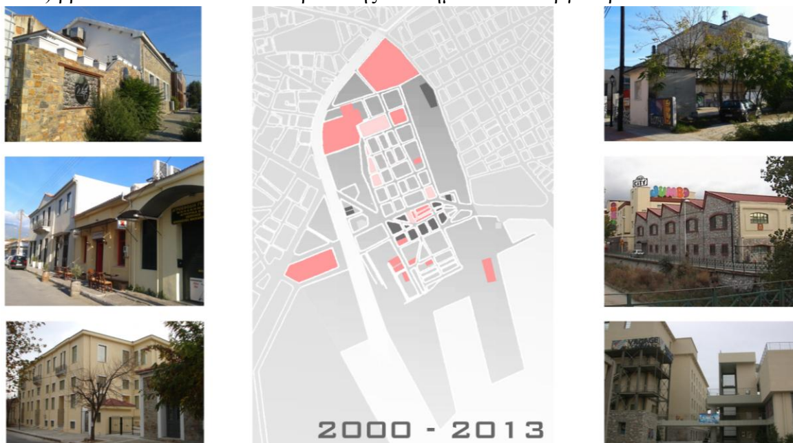
Σχήμα 5. Οι βιομηχανίες που επαναχρησιμοποιήθηκαν στην περιοχή μελέτης σημειώνονται με κόκκινο χρώμα και με γκριζο αυτές που δεν έχουν παραλάβει νέα χρήση. Με ροζ σημειώνονται οι αστικές αναπλάσεις. (σχέδιο, φωτογραφίες Ε. Μπουμπάρη)

Η νυχτερινή διασκέδαση συγκεντρώνεται στην περιοχή πίσω από το Κάστρο στα μέσα της δεκαετίας, ενώ σιγά σιγά αναπτύσσεται γενικότερα η περιοχή. Το 2004 εγκαινιάζεται το εμπορικό κέντρο “Old City” στις εγκαταστάσεις της πρώην υφαντουργίας Παπαγεωργίου. Ένα ανεξάρτητο τμήμα του εργοστασίου λειτουργεί ως κέντρο διασκέδασης. Τον επόμενο χρόνο εγκαινιάζεται λίγα μέτρα παραπέρα ο πολυώροφος ψυχαγωγίας “Village” στους πρώην κυλινδρόμυλους Λούλη. Τον Ιούνιο του 2007 εγκαινιάστηκε το Μουσείο Τελωνειακής Ιστορίας στη μια πέτρινη αποθήκη του λιμανιού. Το 2009 γίνεται η έναρξη εργασιών αποκατάστασης της καπναποθήκης Παπάντου προκειμένου να στεγάσει το Μουσείο της Πόλης. Το κτίριο αυτό τον καιρό (Οκτώβριος 2013) βρίσκεται σε διαδικασία παράδοσης στο δήμο από τον εργολάβο.