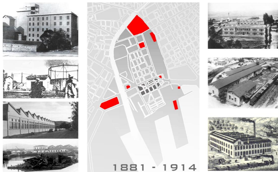
Σχήμα 1. Οι βιομηχανίες που κατασκευάστηκαν στην περιοχή μελέτης. Σημειώνονται με κόκκινο χρώμα οι νέες και με γκριζό ο αρχικός πυρήνας των “Παλαιών”. (σχέδιο Ε. Μπουμπάρη, φωτογραφίες από “Τα βιομηχανικά κτίρια στο Βόλο” του Κ. Αδαμάκη)

Στην κρίσιμη δεκαετία μετά την προσάρτηση το 1881, η όψη της συνοικίας των Παλαιών και του Κάστρου άλλαξαν άρδην καθώς προτάθηκε και εφαρμόστηκε πολεοδομικό σχέδιο το οποίο διεπόταν από απλό ορθογωνικό κάναβο, που ενοποιούσε τις “δυο” πόλεις. (Χαστάογλου, 2002) Σταδιακά η νέα ρυμοτομία πέρασε και στη συνοικία του Κάστρου “απαλείφοντας τελείως τη διάταξη του παλιού οικιστικού ιστού”. Παράλληλα η συνοικία είχε αρχίσει να εμφανίζει τα πρώτα σημάδια της βιομηχανικής της όψης, αφού ήδη από το 1872 λειτουργούσε το βυρσοδεψείο Νικούλη. Το 1883 ιδρύεται η Κλωστοϋφαντουργεία του Τζίμα (Χαστάογλου, 2009), το 1895 ξεκινά η λειτουργία του εργοστασίου αερίοφωτος, στη θέση των σημερινών ΚΤΕΛ, το οποίο φωτίζει την πόλη μέχρι την ίδρυση της Ηλεκτρική Εταιρίας το 1911, ενώ το 1889 ιδρύεται το μηχανουργείο Παπαρήγα δυτικά του προσφάτως παροχτετευμένου (1888) χειμάρρου Κραυσίδαωνα.