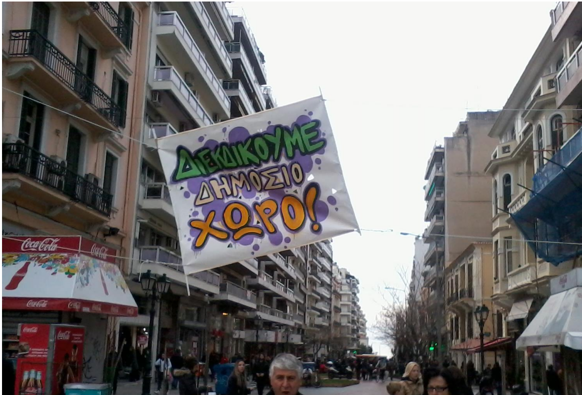
Σχήμα 2. Θεσσαλονίκη 2013. Πεζόδρομος Αγίας Σοφίας