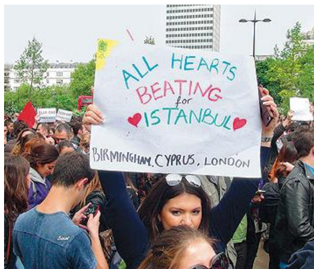
Σχήμα 5, 6. Διαδηλωτές σε Θεσσαλονίκη και Λονδίνο