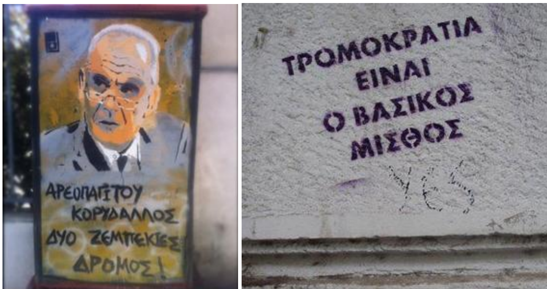
Εικόνα 3,4. Stencil στη περιοχή του κέντρου της Αθήνας την περίοδο 2012-13.

Επιπλέον, μελετώντας το σύνολο των παρεμβάσεων παρατηρήθηκε ότι εκτός της αναζήτησης μιας κριτικής επί των γεγονότων της επικαιρότητας έχουμε και τη προσπάθεια δημιουργίας ενός είδους προπαγάνδας για την «αποκάλυψη» της πραγματικής πρόθεσης της κυβερνητικής εξουσίας (Εικόνες 3,4). Αυτό το προπαγανδιστικό χαρακτηριστικό των πολιτικών stencil ενώ έχει κάποια κοινά χαρακτηριστικά με άλλες μορφές προπαγάνδας διαφέρει στη βάση του. Ως παράδειγμα μπορούμε να πάρουμε τη χρήση του δημόσιου χώρου ως τόπου μετάδοσης κρυφών ή μη μηνυμάτων και τη χρήση της συνεχούς επανάληψης φράσεων-τσιτάτων από τη διαφημιστική βιομηχανία (χρήση τεχνικών και τεχνασμάτων που χρησιμοποιεί η διαφήμιση). Όμως στην περίπτωση που ερευνούμε διαφέρει ο σκοπός. Στόχος δεν είναι ένα προϊόν, είναι η νοητική επαγρύπνηση μέσω της ενεργοποίησης της κριτικής σκέψης, η οποία θα οδηγήσει στην (δια)νοητική απελευθέρωση. Για αυτό το λόγο την νέα μορφή προπαγάνδας που προτείνεται την ονομάζουμε κριτική προπαγάνδα. Η όξυνση της κριτικής ικανότητας του ατόμου είναι αυτή που θα του δώσει τελικά την δυνατότητα να μπορεί να αναγνωρίζει, να στοιχειοθετεί, να επιχειρηματολογεί και να βγάζει συμπεράσματα απέναντι στην police order.