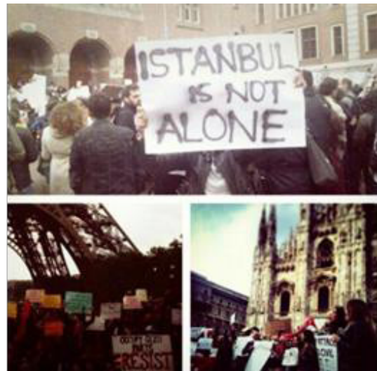
Σχήμα 3, 4. Διαδηλωτές σε Παρίσι