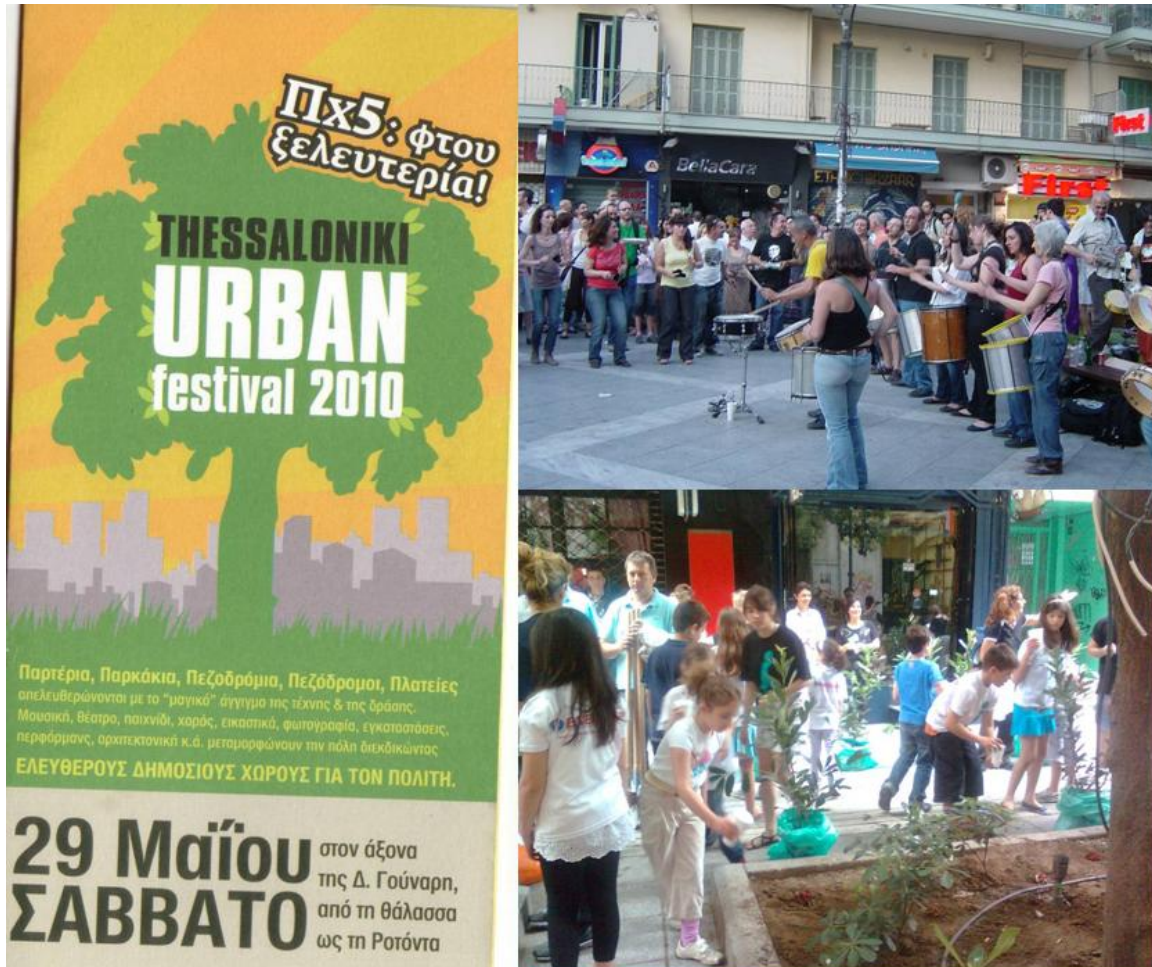
Σχήμα 1. Θεσσαλονίκη 2010. Η διεκδίκηση του δημόσιου χώρου.