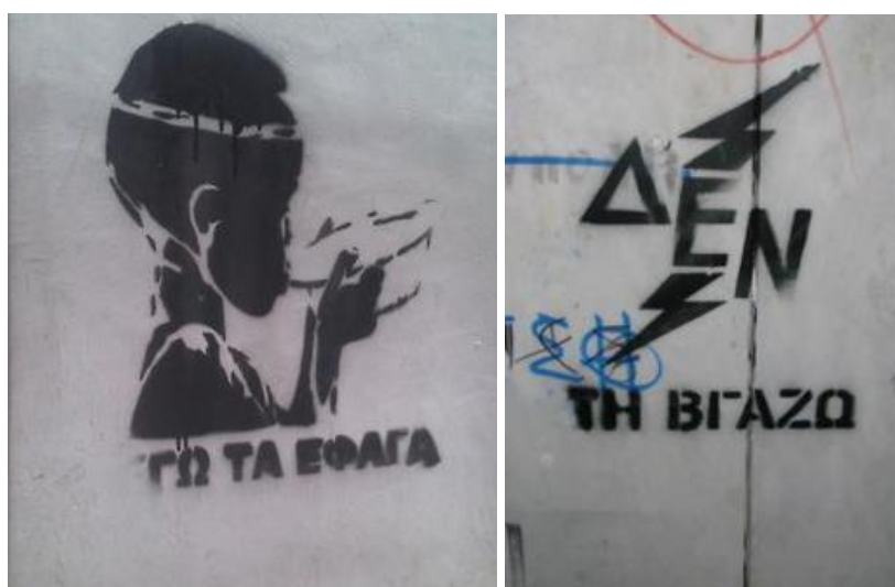
Εικόνα 1, 2. Stencil στη περιοχή του κέντρου της Αθήνας την περίοδο 2011-12.

Σημαντικό για την κατανόηση του κώδικα που φέρει η νέα «τέχνη του δρόμου» είναι το ίδιο το μέσο που αυτή χρησιμοποιεί. Το stencil (στένσιλ) είναι η στάμπα. Μια χαραγμένη ή κομμένη «μήτρα» από την οποία μπορούμε να έχουμε πολλαπλά αντίτυπα της ίδιας χαραγμένης επιφάνειας. Με τον τρόπο αυτό μπορούν να απεικονιστούν λέξεις, σχήματα, εικόνες σε όποια επιφάνεια (τοίχο, χαρτί κ.λπ.) επιλέξει ο δημιουργός. Στη συγκεκριμένη έρευνα μας ενδιαφέρει το πολιτικό stencil, στον όρο αυτό εμπεριέχουμε δηλαδή όλες εκείνες τις παρεμβάσεις (στους τοίχους της πόλης), οι οποίες αναγράφουν, υπονοούν, σχολιάζουν, μετασχηματίζουν κάποιο γεγονός που σχετίζεται με την πολιτική διακυβέρνηση και την κυβερνητική εξουσία της χώρας (Εικόνες 1,2).