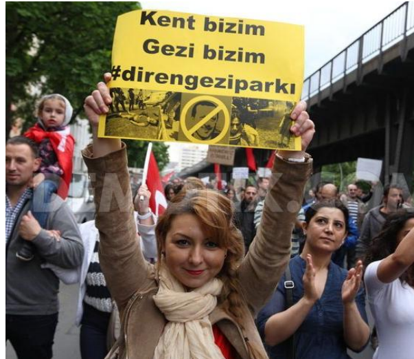
Σχήμα 1, 2. Διαδηλωτές σε Βερολίνο